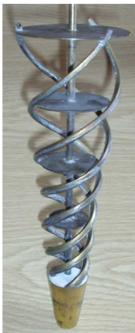
Variationen von Sogwendeln