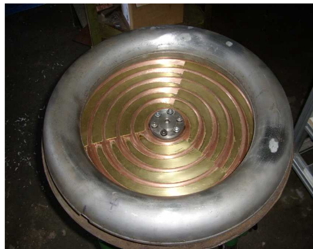
Nachbau eines Vorgängermodells basierend auf Skizze aus 1942