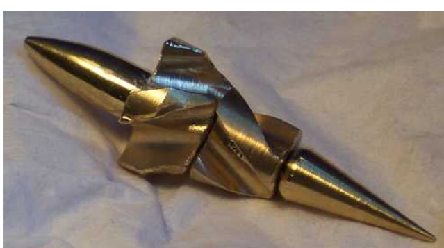
Innenteil der Düse