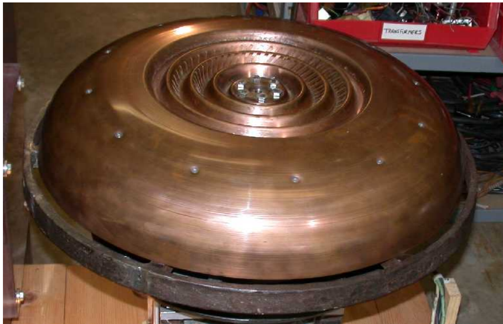
Repulsive Originalmodell im Testlauf