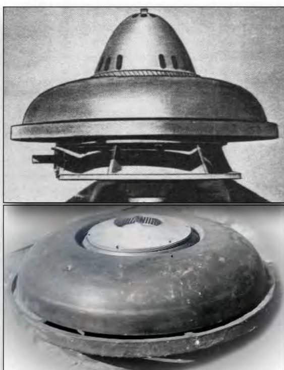
Schaubergers bekannten Modelle der Repulsine

- warnte sein Leben lang vor den Auswirkungen „unserer“ Technik, die durch Verwendung des falschen Bewegungsprinzips zu ständig steigenden Abbau- und Zerstörungsprozessen führen muss.