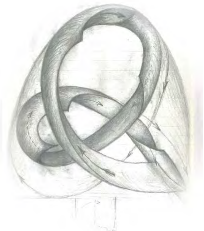
Handzeichnung von Viktor Schaubberger

- war ein ständiges Opfer von Anfeindungen und Verleumdungen, bis hin zur betrügerischen Annexion seines Wissens und seiner Erfindungen.